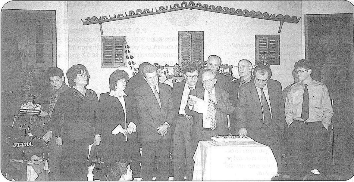
Το Δ.Σ. του Συνδέσμου Απανταχού Καρυατών στο κόψιμο της πρωτοχρονιάτικης βασιλόπιτας, 3-2-02.