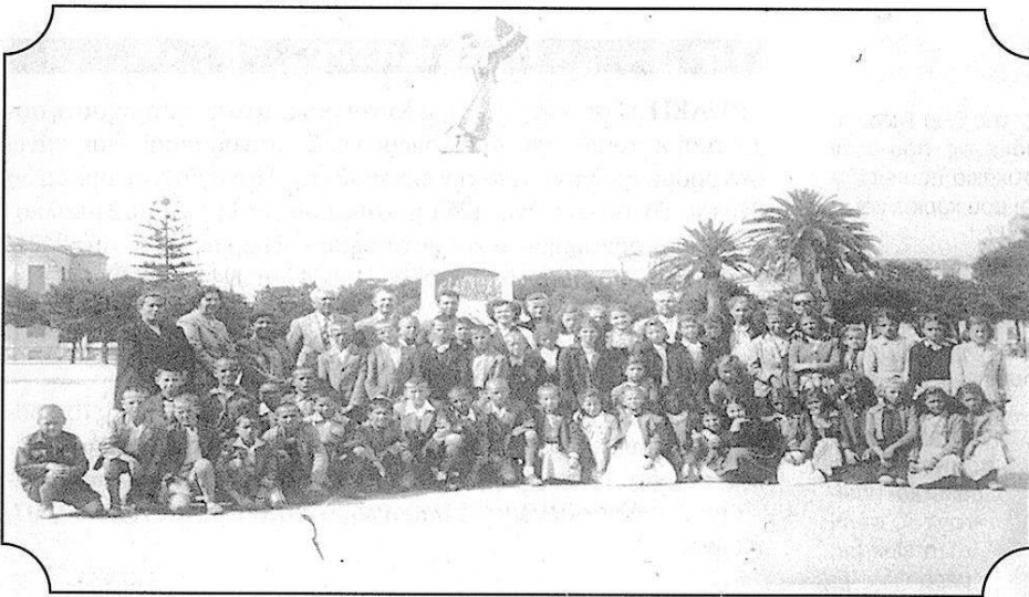
ΠΑΤΡΑ, ΜΑΪΟΣ 1952

Κι ακολουθούν πολλά ακόμη εύθυμα και σατιρικά τραγούδια μέχρι που κουράζονται όλοι και πάνε στα σπίτια τους να κοιμηθούν.